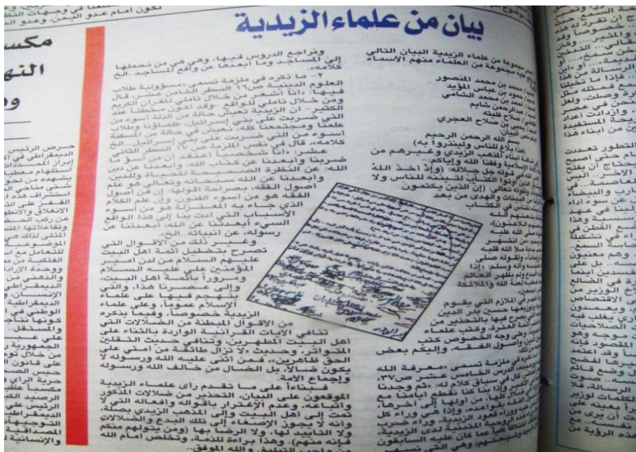
(٤) بيان علماء الزيدية